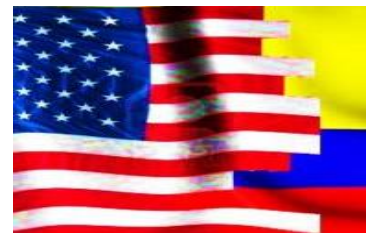
Residente americano para efectos fiscales