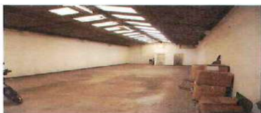
VISTA INTERIOR BODEGA