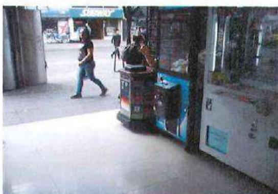
VISTA INTERIOR LOCAL 1 PISO