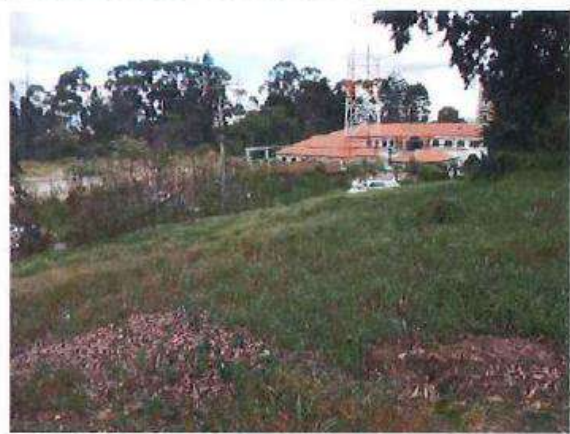
VISTA INTERNA PREDIO