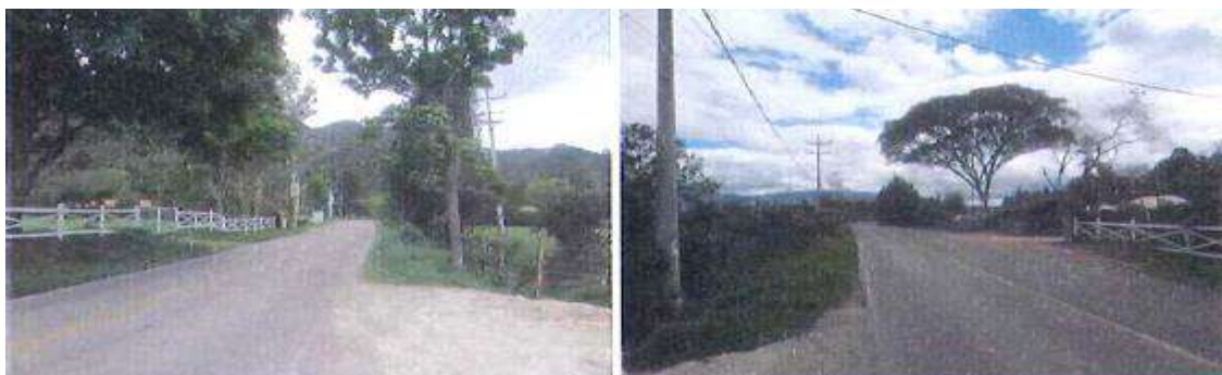
Aspecto general vía Siberia - Tenjo