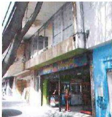
VISTA FACHADA PRINCIPAL