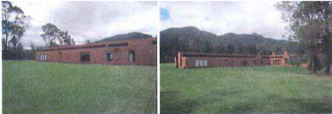
Fachada casa principal