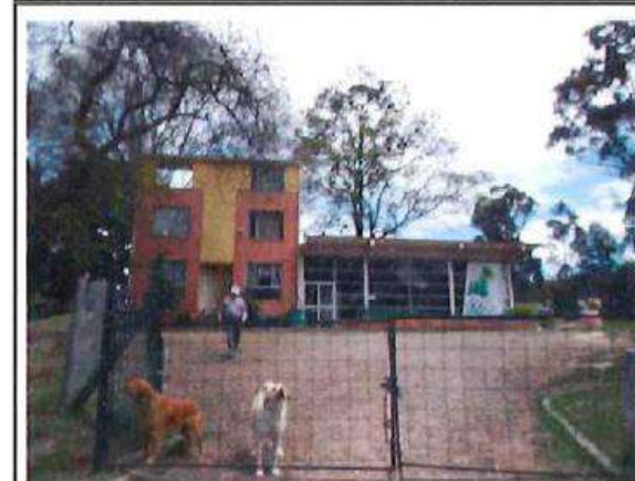
ACCESO PRINCIPAL - FACHADA CONSTRUCCION