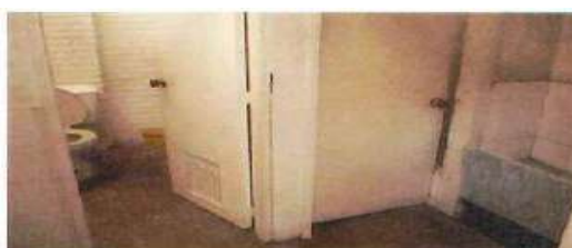
VISTA INTERIOR ZONA SERVICIOS BODEGA