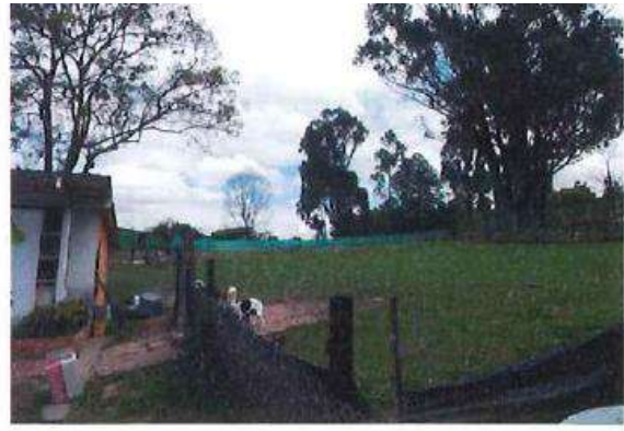
VISTA INTERNA PREDIO