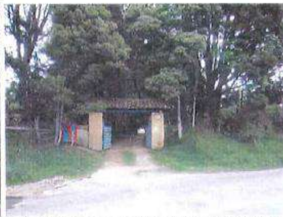
Aspecto general vía Siberia – Tenjo y portada de acceso Finca Huicata