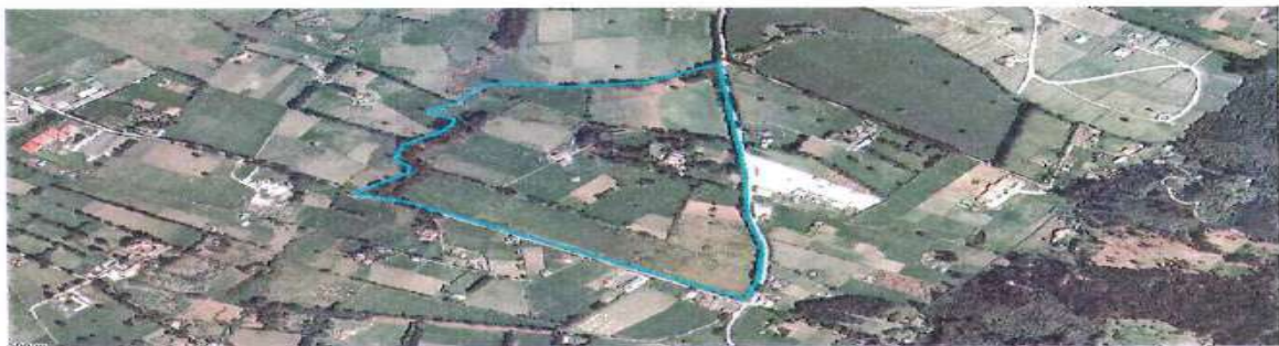
Conformación predial Finca Huitaca