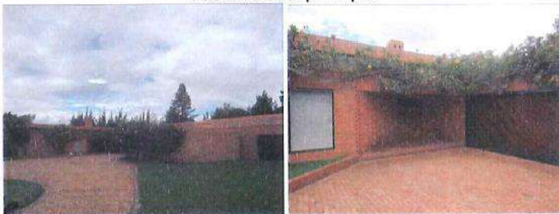
Acceso casa principal

BIEN INMUEBLE CRA 13 N° 63ª-43/ 50C-50963